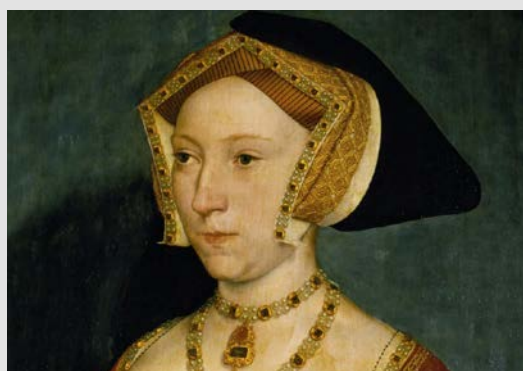
Джейн Сеймур (1508-1537) Жена английского короля Генриха VIII Тюдора, пришла на смену казнённой Анны Болейн. Источник инфекции: инфекционное заражение при родах