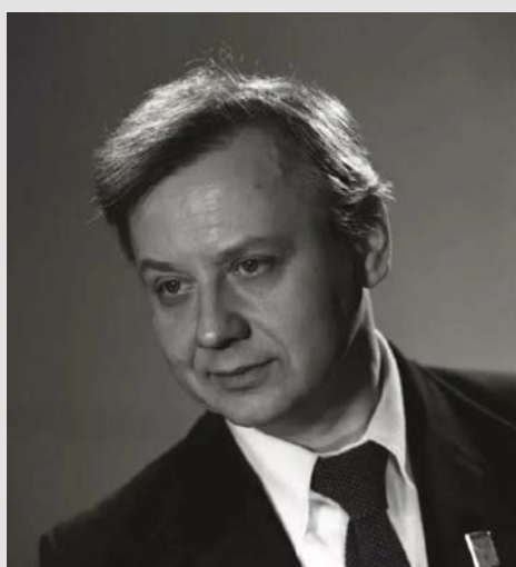
Олег Табаков (1935-2018) Советский и российский актер, режиссер, педагог. Полный кавалер «За заслуги перед Отечеством». Источник инфекции: инфекция зубных имплантов