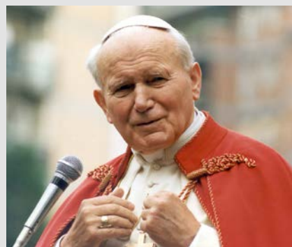
Иоанн Павел II (1920-2005) Папа римский, предстоятель Римско- католической церкви с 16 октября 1978 по 2 апреля 2005 года. Источник инфекции: осложненный ларинготрахеит