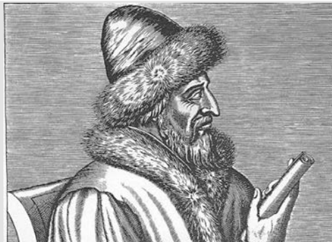
Василий III (1479-1533) Великий Князь Московский и Владимирский, государь всея Руси. Источник инфекции: кожный нарыв