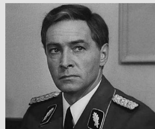
Вячеслав Тихонов (1928-2009) Советский и русский актёр кино и озвучивания, народный артист СССР. Источник инфекции: постоперационный сепсис