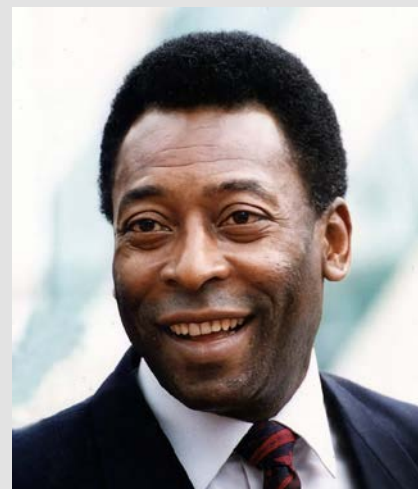
Пеле (1940-2022) Великий футболист Источник инфекции: респираторная инфекция на фоне онкологического заболевания